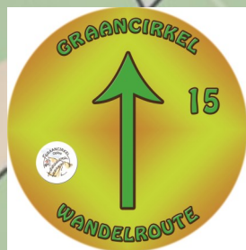
Route aanwijzing Graancirkel